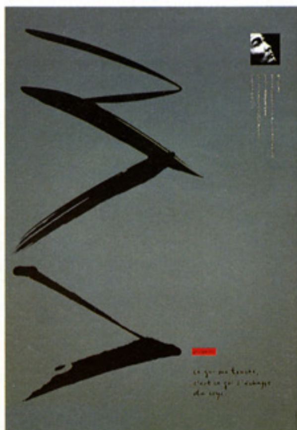
GROUPE MA 公演のポスター。1987年