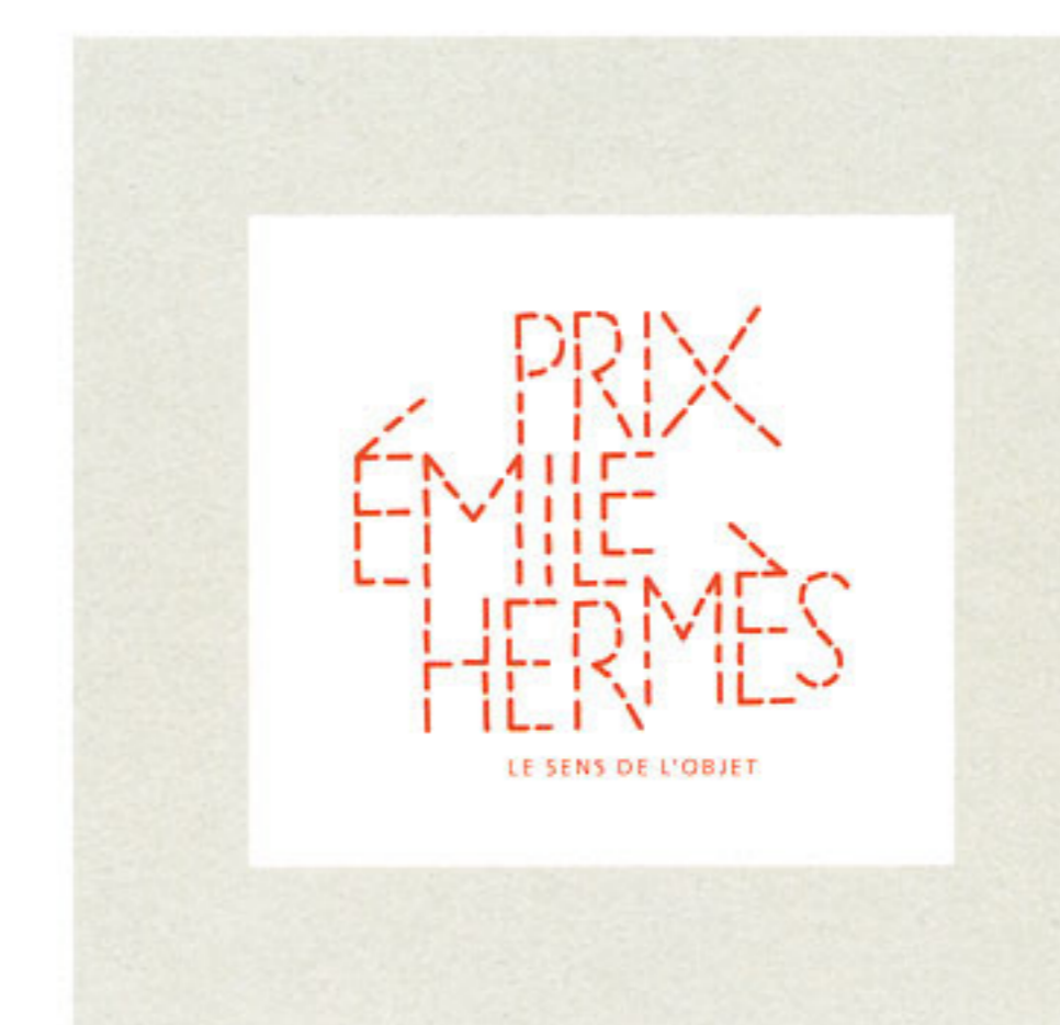
Prix Emile Hermès / Emile Hermès Award Logo, animations, website, ads, poster, invitation... Communication pour la première édition du Prix Emile Hermès, 2007